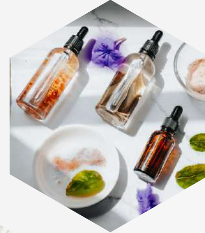
SKINCARE & LIP CARE