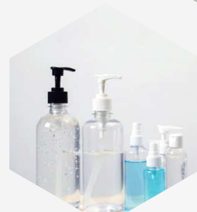
HOME & PERSONAL CARE PRODUCT